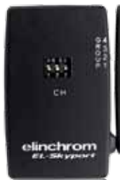
Transceiver RX 19353