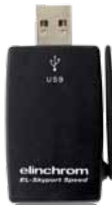
USB RX Speed 19348