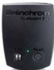
Transmitter ECO 19349