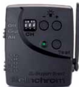
Transmitter Speed 19350

Le module interface USB RX permet de télécommander par le logiciel PC / MAC EL-Skyport 3.x. tous les appareils de la gamme RX équipés du récepteur RX.